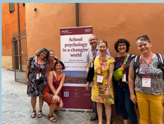
Les représentants des organisations françaises

Dans l'attente, n'hésitez pas à consulter le journal publié par l'ISPA à savoir le World Go Round que nous vous permettons de consulter gracieusement afin de découvrir l'association.